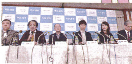
戦争法(安保法制)廃止へ野党の共闘を求めて「市民連合」結成(しんぶん赤旗2015年12月21日)

「戦争法廃止を求め2000万人署名」を集めて、5月3日の憲法記念日に「戦争法はゼッタイ廃止」「野党は共闘」と願う国民の思いをドーンと示しましょう。国民の声で、政治を動かしましょう。