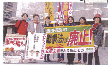
JR高松駅前での女性労働者の憲法宣伝(2015年10月31日)

「仕方ない」とあきらめるわけにはいきません。戦争法を根拠に、日本が「対テロ戦争」に参加すれば、新たな憎しみを生み、日本はテロの標的にされてしまいます。また、南スーダンに派遣するPKO部隊に「駆けつけ警護」などの新たな任務を負わせれば、戦後初めて自衛隊が外国人を殺し、戦死者を出す現実的な危険が生まれます。