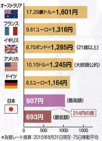
図: 世界各国の最低賃金